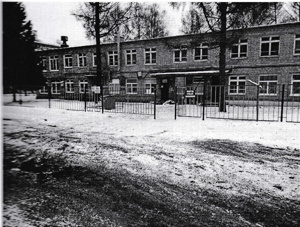
Фото 1 «Территория прилегающая к зданию»